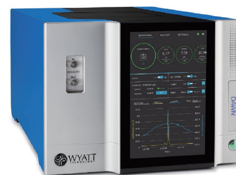
多角度光散乱検出器 DAWN

また、粘度検出器 ViscoStar は、SEC の検出器として使用することで、各種高分子の固有粘度分布を容易に測定します。双方の組み合わせは、様々な高分子の分岐度測定、分子形状解析を可能にします。